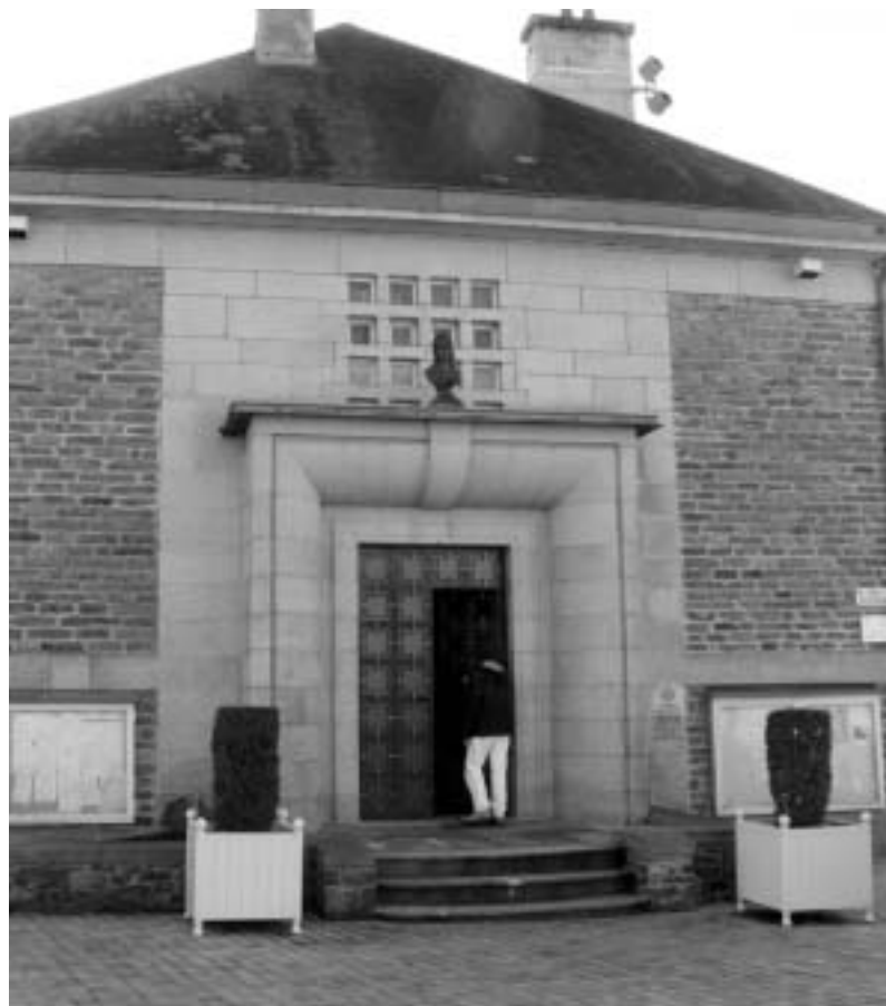
La mairie d'Uzerche, symbole physique de la démocratie municipale, siège de l'entreprise Commune.

La Commune a en charge les animations culturelles (exposition, fête, concerts etc.) soit en étant organisateur ou en épaulant des associations. Elle gère également le cinéma et la médiathèque.